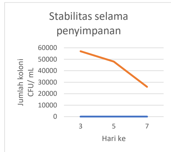
Gambar 4.1 Stabilitas penyimpanan permen probiotik pada hari ke 3, 5 7

Stabilitas penyimpanan permen probiotik diamati pada hari ke 3, 5 dan 7 dapat dilihat pada gambar 4.1